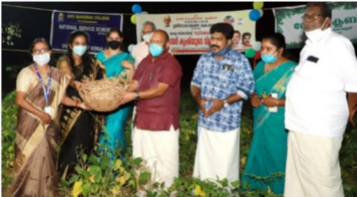
The seed sowing ceremony and the harvesting festival being inaugurated by MLA Shri Mukesh and the Minister of Agriculture V.S Sunil Kumar respectively