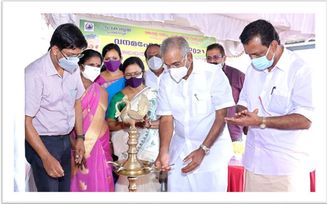
The KANANACHAYA initiative being inaugurated by the Minister of Forest Shri A.K Saseendran