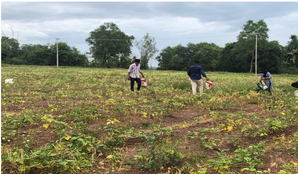
Students Receiving Hands-On Training in Various Agricultural Disciplines