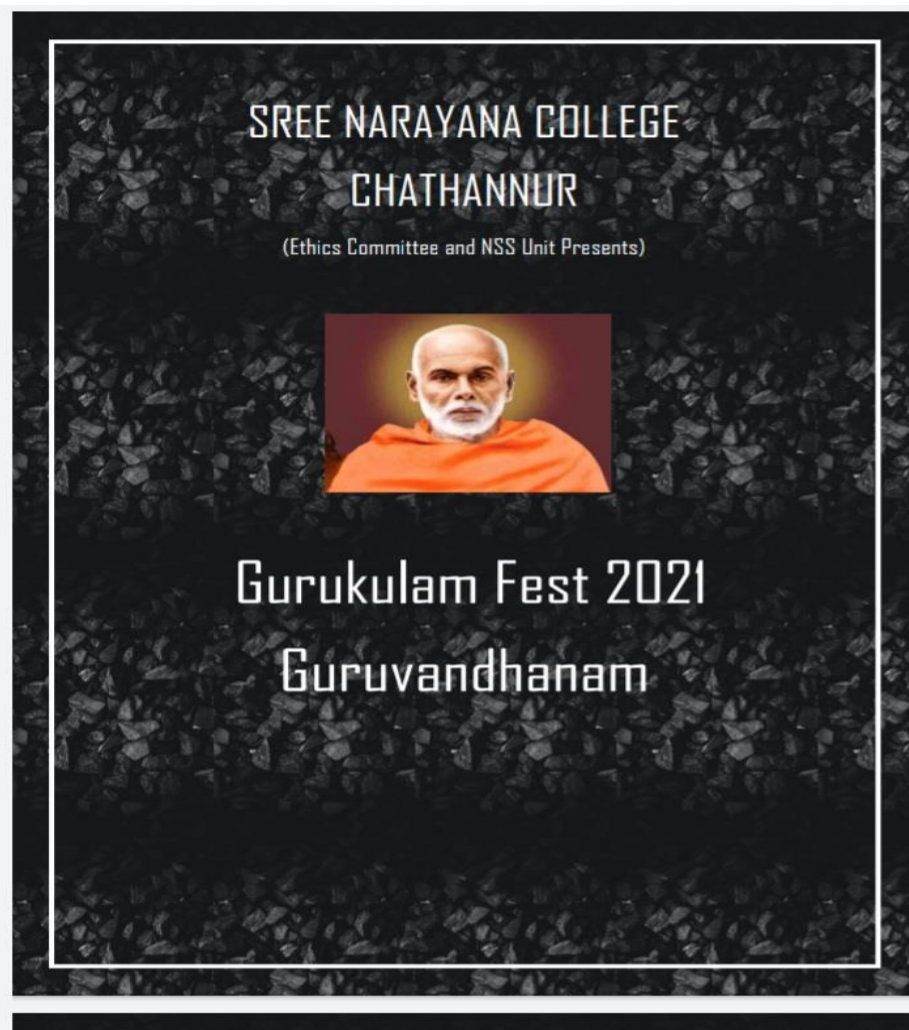
Brochure of the Gurukulam Initiative

The GURUKULAM FEST provided a virtual platform for students to showcase their talents which had received specialised instruction via google meet. The mission of the programme was to nurture the inherent talents of the students who were locked indoors due to the pandemic and prepare them for various competitive examinations. The Vice-Chancellor was excited to perform the launch of the virtual festival, a concept that had never been done before.