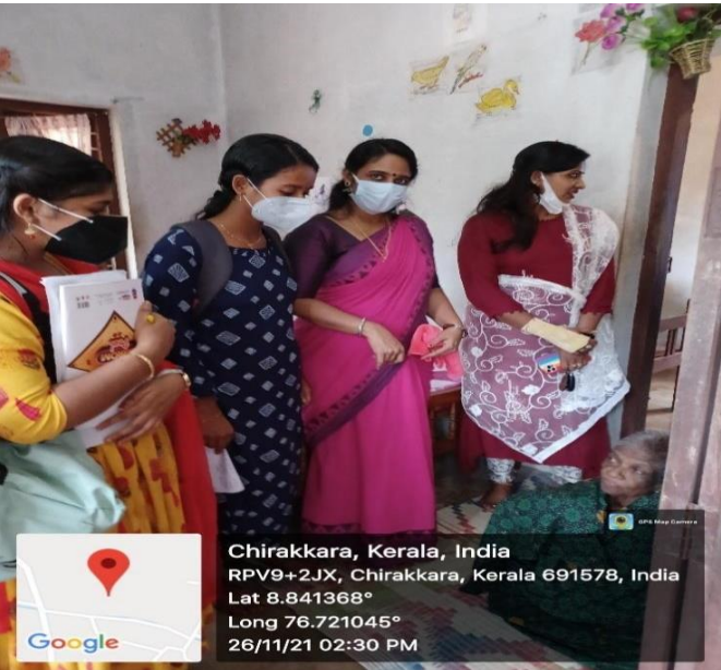
Teachers and Students Engaged in the Palliative Care Initiative

KERALA KAUMUDI EPAPER Clipping Kerala Kaumudi - Kollam