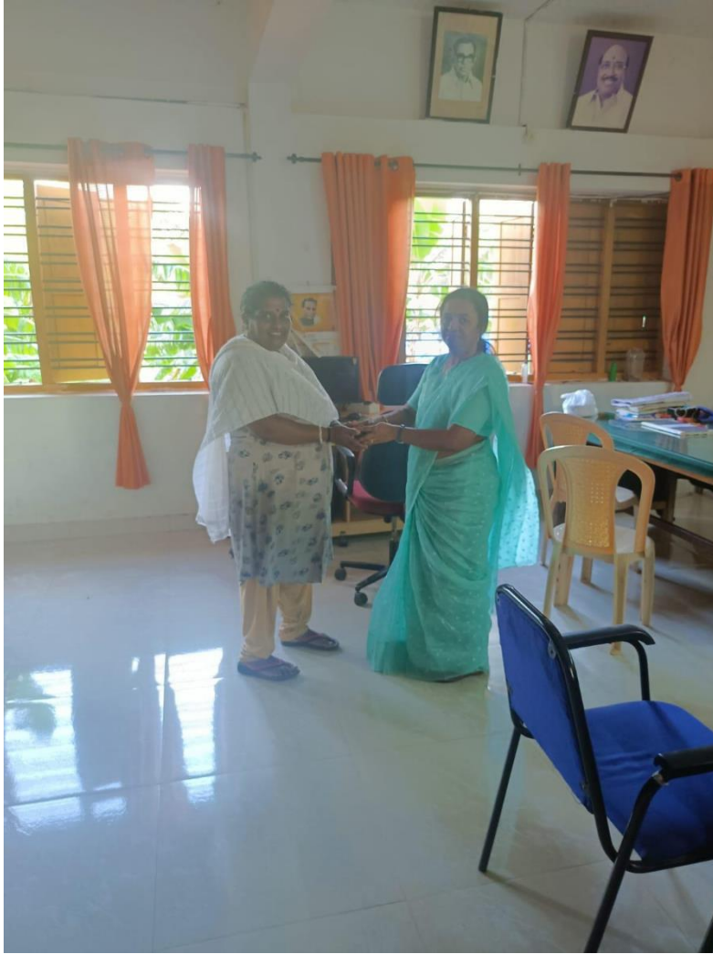
Vegetables being distributed