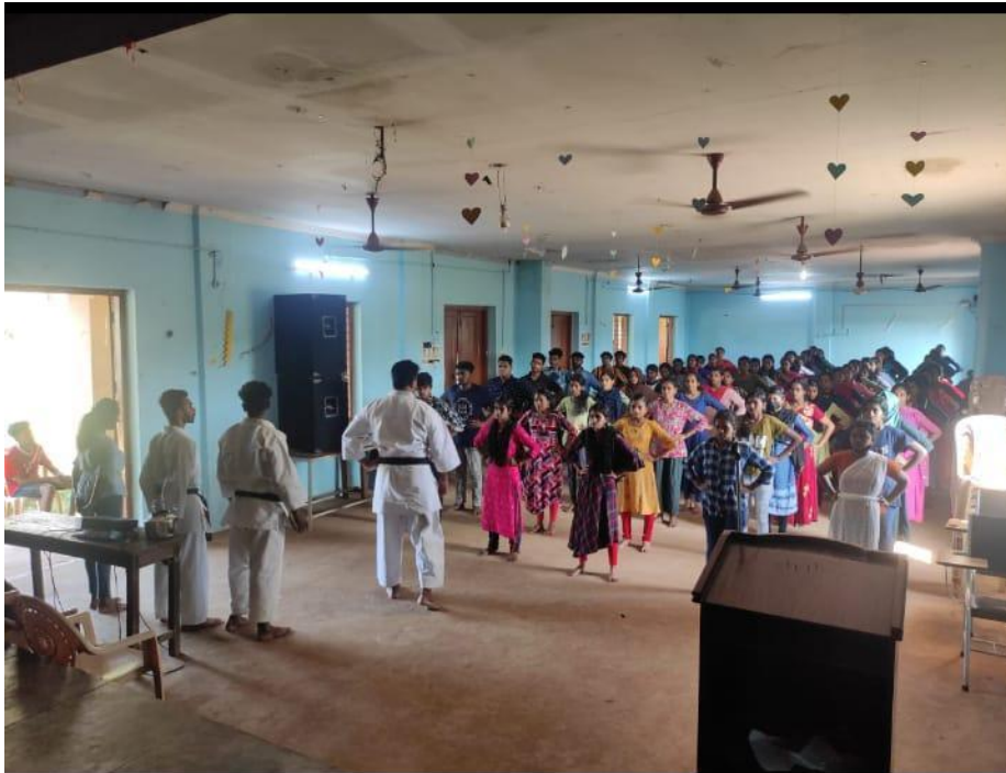
Karate Lessons in Progress